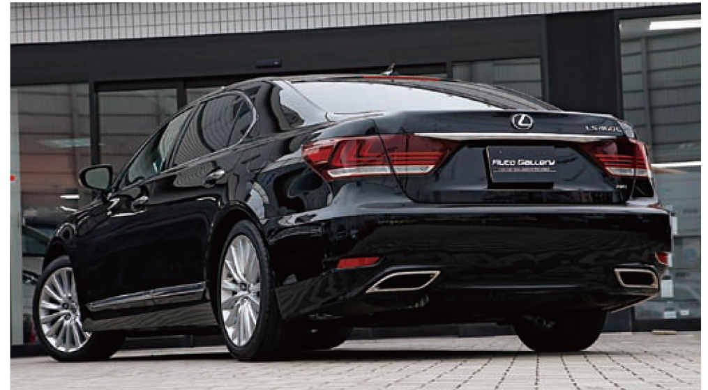
2012年のビッグマイナーで、保守的な印象の強かったLSはアグレッシブな高級車に生まれ変わった。後ろ姿も精悍な印象だ。