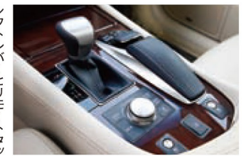
幻想的でも表現したくない、色気のあるメーター照明など、機能だけでなく、演出も日本車らしく精緻。