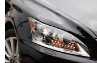
日本仕様ではオプションのLEDヘッドランプに、精緻なLEDクリアランスランプの組み合わせがエキゾチック。