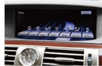
リモートタッチでさまざまな情報が呼び出せる大画面モニターには、自社工場日本仕様ナビもインストール可能だ。