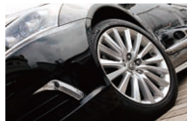
写真のノーマルホイールのほかに、オプションの19インチハイグロス塗装ホイールも用意。直輸入店ならではの多彩な選択肢も魅力だ。

東名高速横浜町田インター近くの輸入車激戦区にあるオートギャラリー東京は、グループの中核店。アメリカ車と逆輸入日本車を中心に、あらゆるクルマを手がける。取材当日にも、日本市場への上陸は春が予定されている新型シボレーコルベットC7が、早くも入荷して注目を集めていた。日本仕様のナビのインストールや法規適合もおまかせだ。