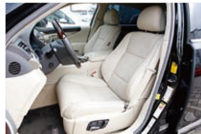
LSはドライバーズカーとしても評価が高い高級車。左ハンドルも個性のひとつだ。