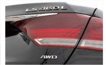
ライン状に点灯するLEDテール&ストップランプが、高級感とスポーティ感をひとときわ調する。