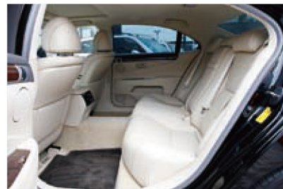
このクルマはロングボディだけに、後席は広大。まさにVIPのためにしつらえられた空間だ。