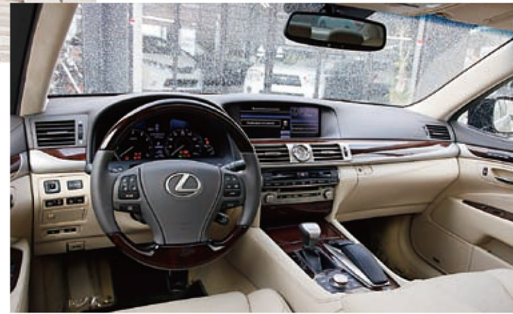
質感、精度、材質まで、申し分のないインテリアは、今日の高級輸入車の多くに影響を与えたクオリティを誇る。