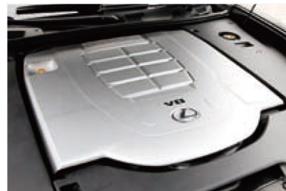
フルカバーの下に息づくエンジンはV8の4・6L。8速ATとの組み合わせで至高の走りを生む。